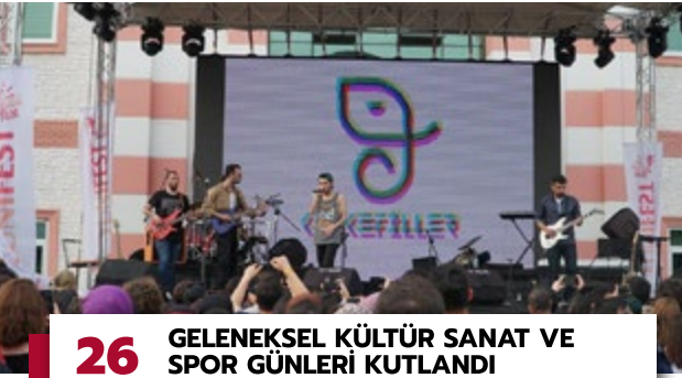
26 GELENEKSEL KÜLTÜR SANAT VE SPOR GÜNLERİ KUTLANDI