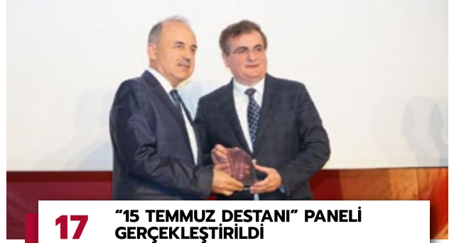
17 "15 TEMMUZ DESTANI" PANELİ GERÇEKLEŞTİRİLDİ