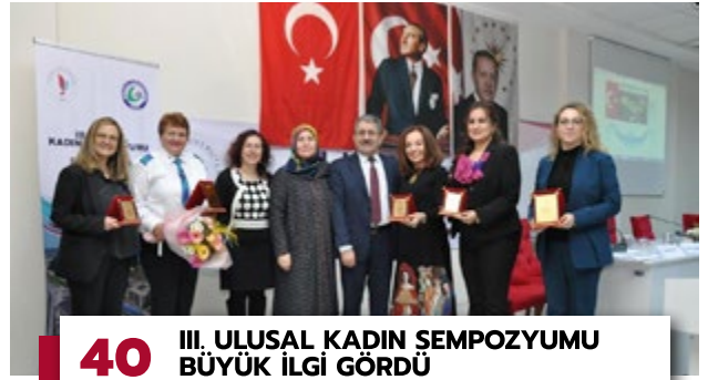
40 III. ULUSAL KADIN ŞEMPOZYUMU BÜYÜK İLGİ GÖRDÜ