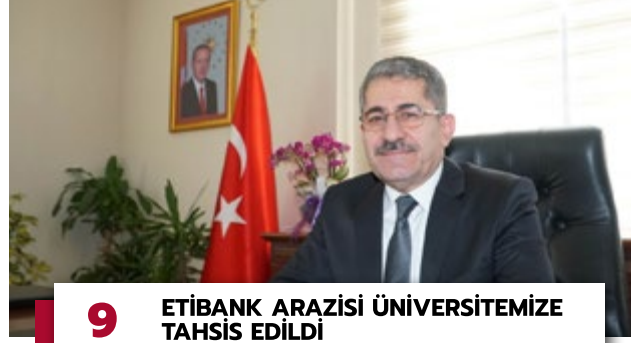
9 ETİBANK ARAZİSİ ÜNİVERSİTEMİZE TAHSİS EDİLDİ