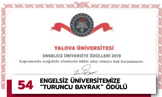
54 ENGELSİZ ÜNİVERSİTEMİZE "TURUNCU BAYRAK" ÖDÜLÜ