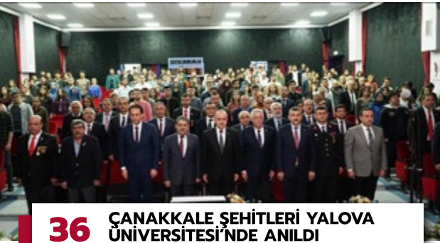
36 ÇANAKKALE ŞEHİTLERİ YALOVA ÜNİVERSİTESİ'NDE ANILDI