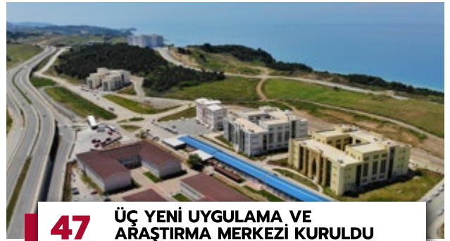
47 ÜÇ YENİ UYGULAMA VE ARAŞTIRMA MERKEZİ KURULDU