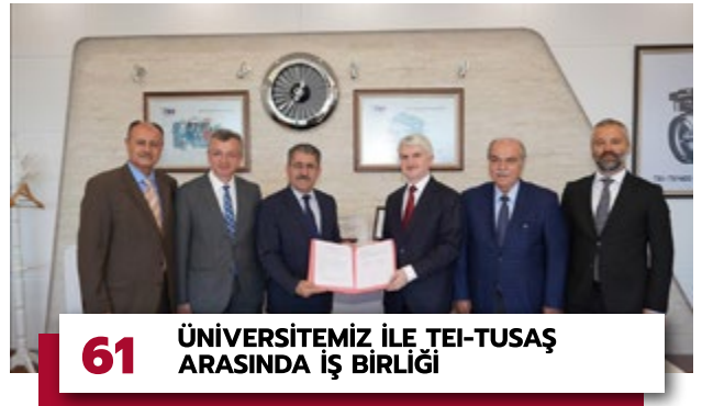
61 ÜNİVERSİTEMİZ İLE TEİ-TUSAŞ ARASINDA İŞ BİRLİĞİ