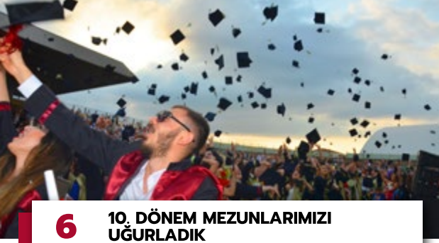
6 10. DÖNEM MEZUNLARIMIZI UĞURLADIK