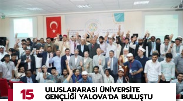
15 ULUSLARARASI ÜNİVERSİTE GENÇLİĞİ YALOVA'DA BULUŞTU