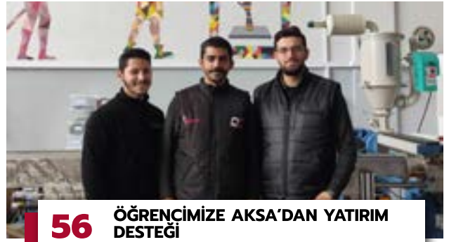
56 ÖĞRENCİMİZE AKSA'DAN YATIRIM DESTEĞİ