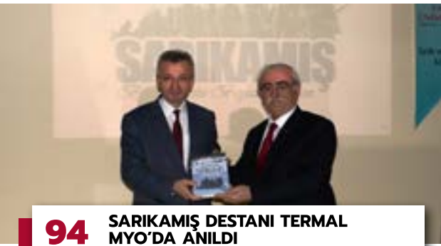
94 SARIKAMIŞ DESTANI TERMAL MYO'DA ANILDI