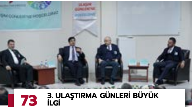
73 3. ULAŞTIRMA GÜNLERİ BÜYÜK İLGİ