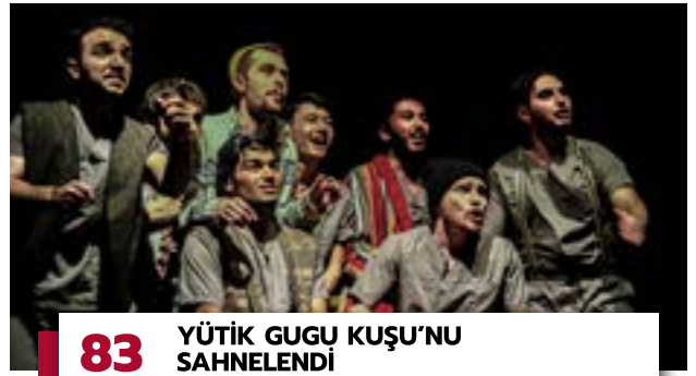
83 YÜTİK GUGU KUŞU'NU SAHNELENDİ