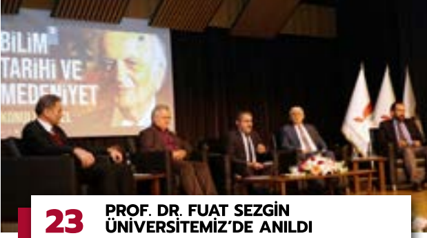
23 PROF. DR. FUAT SEZGİN ÜNİVERSİTEMİZ'DE ANILDI