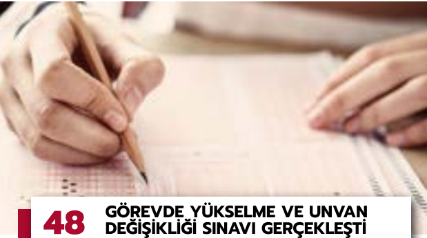
48 GÖREVDE YÜKSELME VE UNVAN DEĞİŞİKLİĞİ SINAVI GERÇEKLEŞTİ