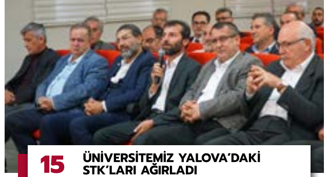
15 ÜNİVERSİTEMİZ YALOVA'DAKİ STK'LARI AĞIRLADI