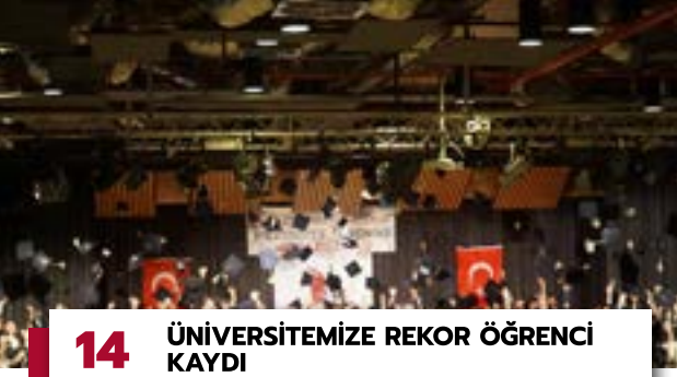
14 ÜNİVERSİTEMİZE REKOR ÖĞRENCİ KAYDI