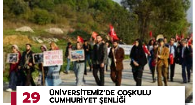
29 ÜNİVERSİTEMİZ'DE ÇOŞKULU CUMHURİYET ŞENLİĞİ