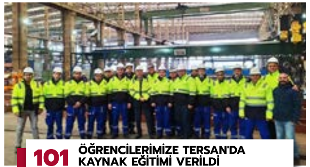
101 ÖĞRENCİLERİMİZE TERSAN'DA KAYNAK EĞİTİMİ VERİLDİ